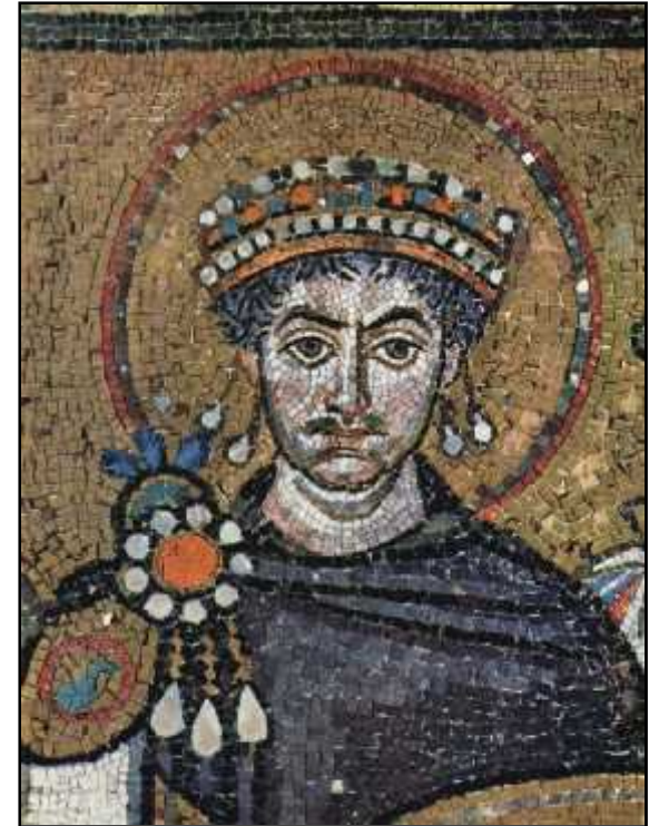
აღმოსავლეთ რომის იმპერტორი იუსტინიანე I 482 (527) – 565 წწ.

მოგვიანებით 535-565 წლებში იუსტინიანემ მოახდინა სამართლის სხვადასხვა დარგის მოდერნიზაცია და კოდიფიკაციის ამ ნაწილს ნოველები ეწოდა.